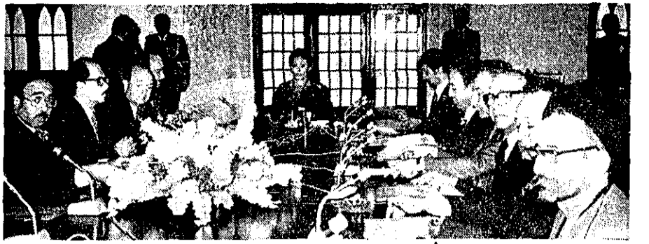
در حضور علیاحضرت شهبانو، هیات امنای بنیاد شهبانو فرح، در مرکز فرهنگی باغ فردوس تشکیل جلسه داد

از طرف بنیاد شهبانو فرح از سال آینده به شخصیت یا اثر برجسته ادبیات معاصر ایران جایزه داده میشود