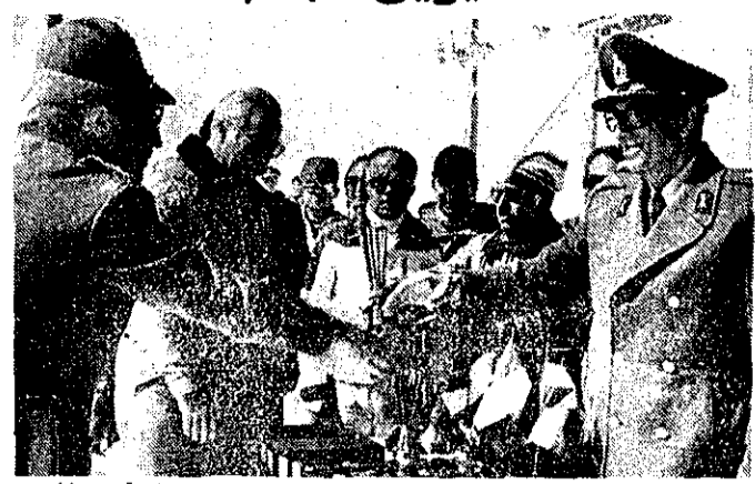
والا حضرت شاهپور غلامرضا پهلوی در پیست اسکای دیزین، جوایز قهرمانان مسابقات بین‌المللی را اهداء کردند. سر تیب هوشمند الماسی رئیس تربیت بدنی نیروهای مسلح شاهنشاهی (دوم از سمت چپ) دیده میشود.