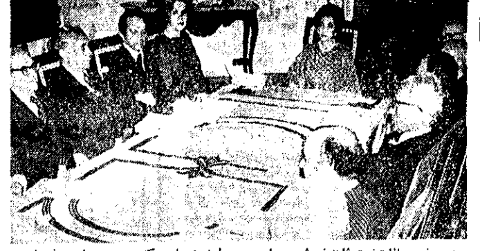
در حضور والاحضرت شاهنشاهی پهلوی، جلسه هیات مرکزی جمعیت شیرو خورشید سرخ ایران، در کاخ خاتمامی ملکه پهلوی تشکیل شد.