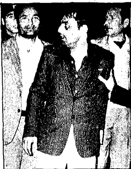
دارپوش وجدانی را مأموران دیروز برای تشریح صحنه جنایت به سر جاهی که پسر بچه را در آن انداخته بود بردند