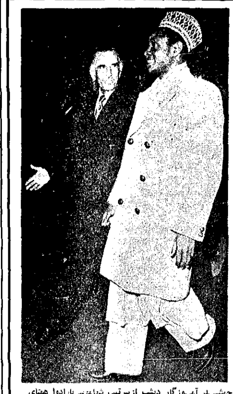
جلسه آسوزگار دیشب از سرتیپ شهبازی یادداشتی نیچریهای خود در مهرآباد استقبال کرد و بوی خوش آمد گفت.

وزیر خارجه عربستان هفت روز در تهران است. وزیر امور خارجه عربستان که در تهران است، در جریان دیدار خود با وزیر امور خارجه ایران، مسائل سیاسی روز را مورد بحث قرار داد. وزیر امور خارجه عربستان در جریان دیدار خود با وزیر امور خارجه ایران، مسائل سیاسی روز را مورد بحث قرار داد.