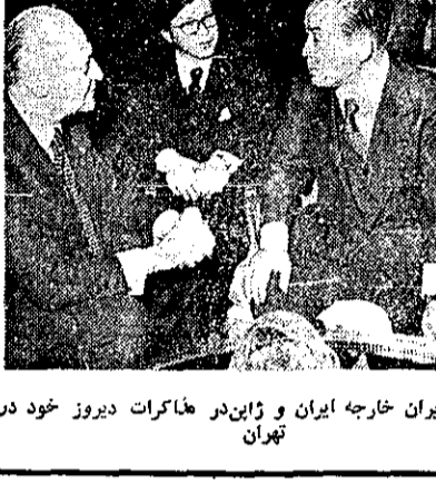
وزیران خارجه ایران و ژاپن در مذاکرات دیروز خود در تهران.

مجلس نمایندگان آمریکا در ضیافت وزارت خارجه شرکت کرد. نمایندگان مجلس آمریکا در ضیافت وزارت خارجه شرکت کرد. نمایندگان مجلس آمریکا در ضیافت وزارت خارجه شرکت کرد.