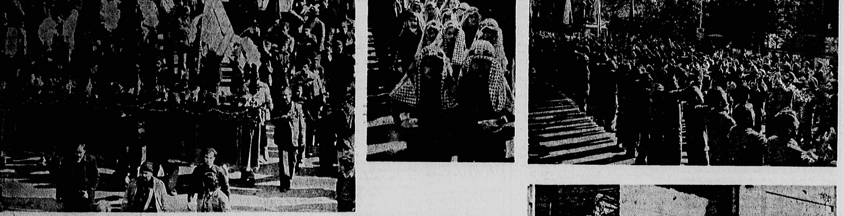
میلیو نهاعز ادار حسینی، قافله سالار شهیدان را همراهی کردند. در این مراسم، کودکان نیز با نوحه و سرود، روحیه جهاد را ترویج دادند.

میلیو نهاعز ادار حسینی، قافله سالار شهیدان را همراهی کردند. در این مراسم، شرکت کنندگان با نوحه و سرود، روحیه جهاد را ترویج دادند. این مراسم در شهر اهواز برگزار شد و به رهبری روحانیان برجسته انجام گرفت.