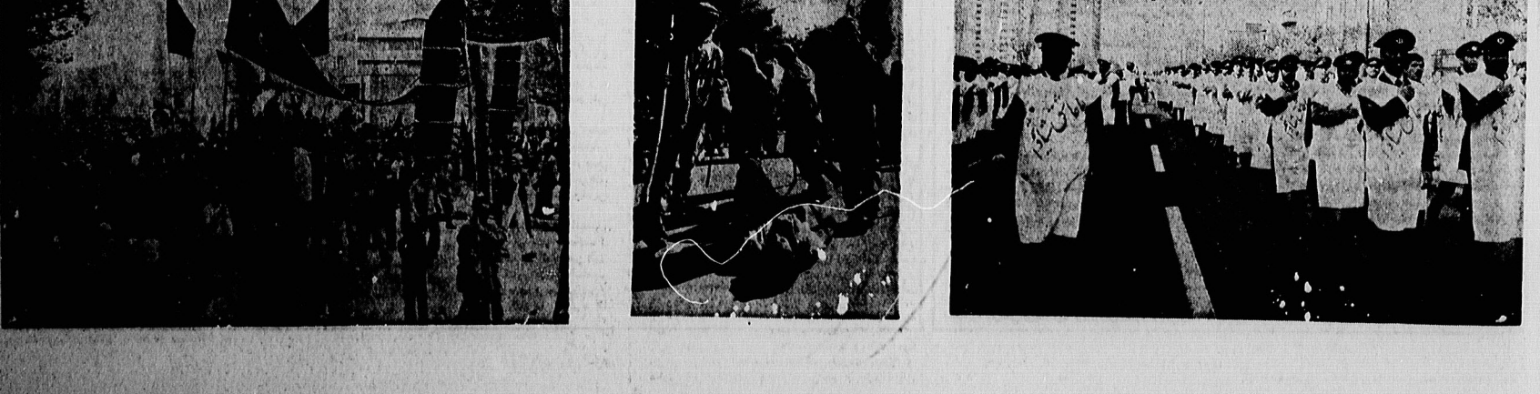
میلیو نهاعز ادار حسینی، قافله سالار شهیدان را همراهی کردند. در این مراسم، کودکان نیز با نوحه و سرود، روحیه جهاد را ترویج دادند.