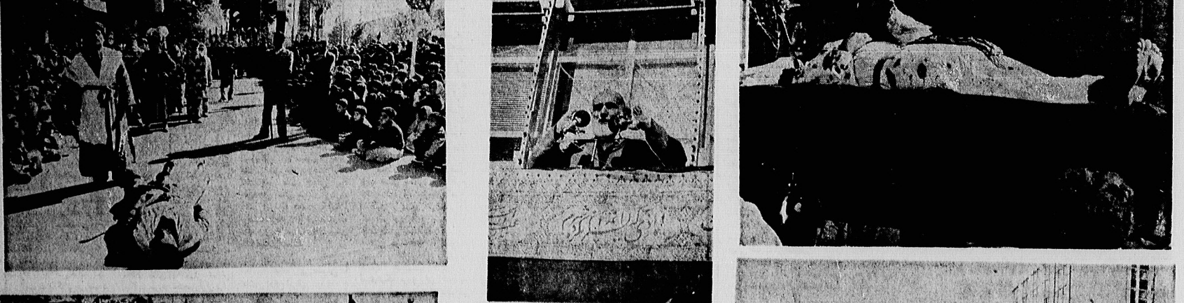
میلیو نهاعز ادار حسینی، قافله سالار شهیدان را همراهی کردند. در این مراسم، کودکان نیز با نوحه و سرود، روحیه جهاد را ترویج دادند.