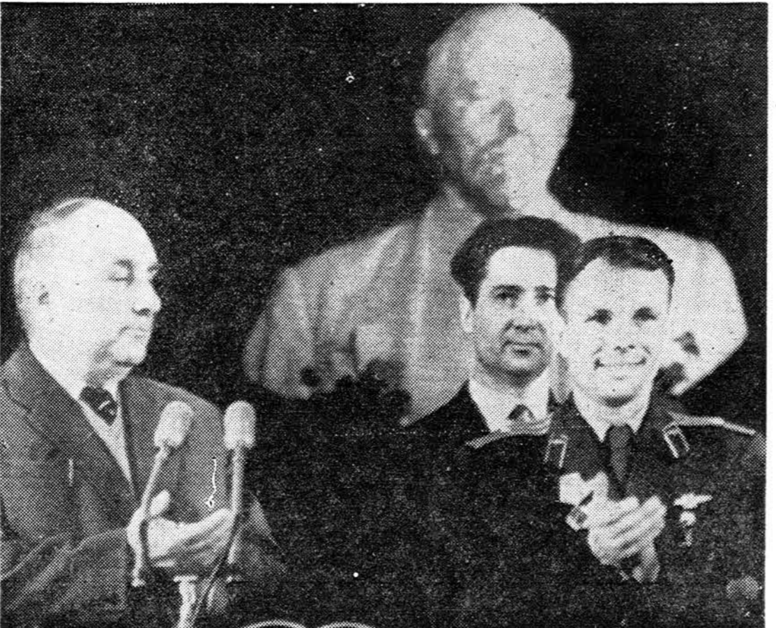
گمارین، نخستین انسان فضایی همراه با آکادمیسین لیتوانوف رئیس آکادمی علوم شوروی در کنفرانس مطبوعاتی شرکت کرده است. عکس رادیویی اطلاعات

طوفان و باران شدید در بندر پهلوی چندگشتی شوروی بعلت طوفان شدید نتوانسته اند از بندر حرکت کنند در شهرهای دیگر شمالی نیز بارندگی بشدت ادامه دارد گزارش خبرنگاران ما در شهرستانها حاکی است که هنوز هم بارندگی در اغلب شهرستانها مخصوصا شهرستانهای شمالی ادامه دارد و در بعضی نقاط این بارندگی توام با طوفان شدید می باشد. طوفان و بارندگی خبرنگار ما در بندر پهلوی تلفنی گزارش داد از ساعت شش صبح بقیه در صفحه هفتم