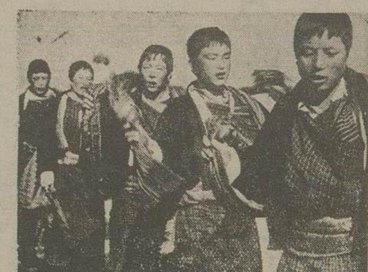
تبت ۸۶۶۳ متر از سطح دریا ارتفاع دارد و رود خارجی ها با آن کشور ممنوع و مشکل است. مگر اینکه قبلا لاما اجازه داده باشد.

هر مرد می‌تواند زنان متعددی داشته اما زن گرفتن برای لاما ممنوع است ولی لاما می‌توانند هر زن را برای هر مدتی که میخواهد در تملک خود نگاهدارند و پرچم تبت دراز و رنگ سفید است که چند خط قرمز روی آن دیده میشود غیر از سبازان اجیر شده و فدائی و لاماه ارتش و نفرات نظامی دیگری در تبت دیده نمیشوند، کلیه امور رزق و تقو جریانات بدست روحانیون است.