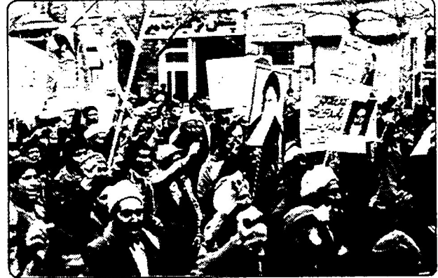
شرکت دهقانان، خراسانی در تظاهر آتی که جهاد سازندگی مشهد در تیب داده بود

ایرانی، به قول امام خمینی، "زلزلنده" را آباد کردن، روستاهای ویران شده از ستم شاهان و استثمار بزرگ مالکان را از نوساختن، نه تنها روستا، بلکه روستایی ایرانی را دوباره از ریشه رویاندن، کار آسانی نیست. جهاد سازندگی به انجام این کار دشوار، ولی پرافتخار کمر همت بسته است. جهاد تاکنون نقش پررنگی در بازسازی روستاها و به ویژه در نحوه برخورد بعلکی تازه ای با مسائل روستاها ایفا کرده است. جهاد نمونه های شده است از آنچهارگان و نهادهای مسئولان و ادارات می باید در یک نظام انقلابی و مبتنی بر مردم و در خدمت مردم باشد. بدون تردید اگر برخی مشکلات و نارسایی ها، نظیر نداشتن بودجه و امکانات کافی و نداشتن اختیار عمل، نظیر سهل انگاری ها و ندانم کاری ها و حتی رقابتها و کارکنی های ادارات مختلف و نداشتن برنامه دقیق و همه جانبه، که سراسر فعالیت جهاد را در برگیرد و امکانات رایج کاسکند، نظیر برخی تکرویها و تنگ نظریها، که فترا مشکلاتی در انجام وظایف بوجود می آورد و جهاد را از نیروی جوشان و مستوری محروم می کند، و نظایر اینها، نبود، کار عظیم و به جرات می توان گفت، تاریخی جهاد سازندگی باز هم پرشتر و نتایج آن ژرف تر می شد. حماسه ای که "جهاد" ها آفریده اند و فدکاریهایی که، علیرغم مشکلات، انجام داده اند، باعث شده است که بیلان درخشانی از کار جهاد در مشهود همه انقلابیون صدیق امیدوارند که سطح فعالیت این نهاد نمونه انقلابی، باز هم بالاتر رود و نتایج بازم عالی تری به دست آید.