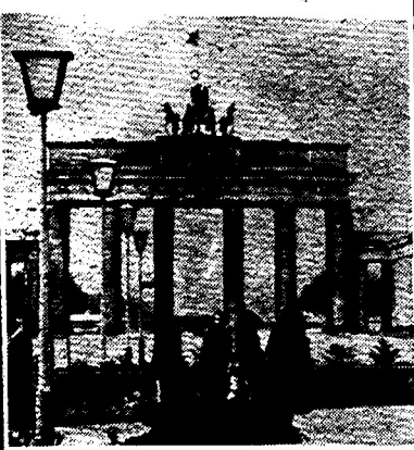
«دروازه براندنیورگه» (برلین، پایتخت جمهوری دمکراتیک آلمان): آنجا که خطر تجاوز و چپاول امپریالیسم پایان می‌یابد و از مرز سوسیالیسم و صلح قاطعانه پاسداری میشود.