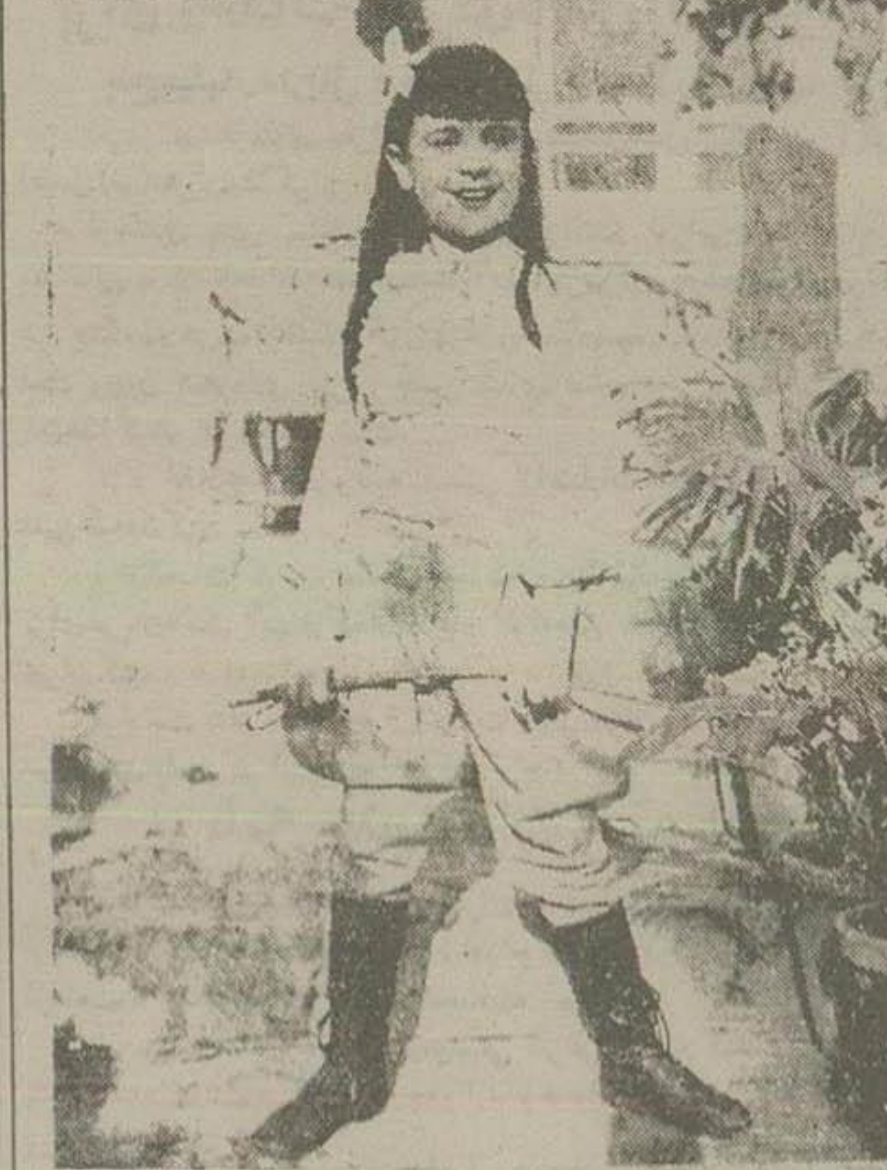
باشرک فیروز (واحد) و رفاه هتر مند تحیه کاریو کا شروع بوزم و وزیم بود از ظهر ۱۳۳۲-آ داون طوطی

بمداد امروز اعضای کمیته فزی یک جلسه خصوصی تشکیل داده و درباره تاریخ جلسات بعدی کنفرانس مذاکره و تبادل نظر کردند. گفته میشود که ممکن است امشب اعضای کمیته با دیگر بارش جمهوری مصر ملاقات کنند. تاکنون رئیس جمهوری مصر بهیچوجه حاضر بقبول اصل بین المللی شدن کال سوز نشده و اعضای کمیته نیز در باره آیدامه اموزگان با سازمان جهانی برای آزادی های شوروی در بنادر آلبانی مشغول است و احتمال می رود که عملاً با این دست مواجه شده است. همانند مصر در کنگره انس ریاض لندن در سه سهره که بد لاسر رئیس جمهور مصر در ویشک یوسف باسین معاون وزارت خارجه سنان بحضور پذیرفته و با وی مدتی مذاکره کرد. اعلامیهای واجبه به این کنفرانس که پس از چهار ماه شام که عبدالناصر برای مژس و نمایندگان ه کشور در مصر محمدعلی ولهدسا قی مصر در کتا رودخان عیل داده بود داده شد در ایستادگی بحال عبدالناصر رئیس جمهوری مصر ملاقات کرد. گفتگوی وزیر خارجه ایران با رئیس جمهوری مصر مدت یک ساعت طول کشید و در پایان این ملاقات آقای دکتر اردلان از مذاکرات خود با رئیس جمهوری مصر اظهار رضایت کرده و بخت نگرانی گفتند که جریان کارها رویشرفت است. پس بخت اگره - خبرگزاری فرانسه - مذاکرات اعضای کمیته پنج نفری کانال سوئز با سرهنگ جمال عبدالناصر