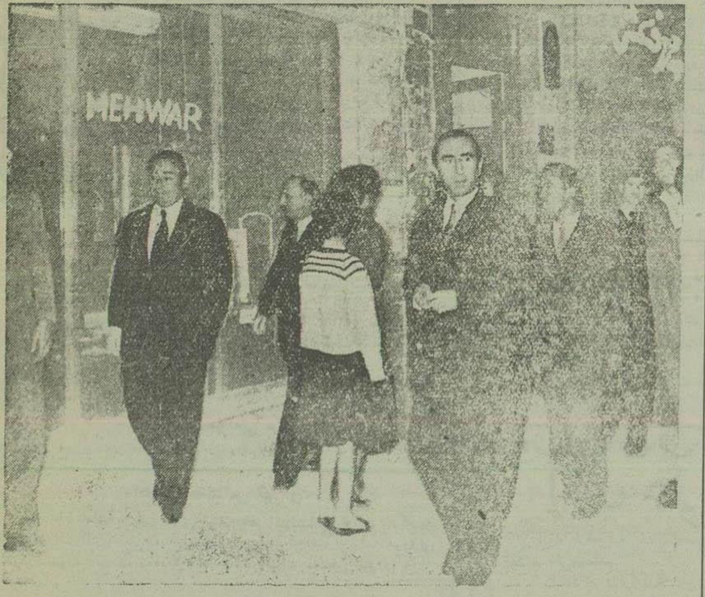
دشمن عدنان مندرس نخست وزیر ترکیه مدتی در خیابان لاله زار گردش کرد...

من مواد شش و هفت و ده اعلامیه از بهترین مواد آن میباشد زیرا این مورد نتیجه اقدامات کمیته اقتصادی و علائقندی و پشتیبانی دولت امریکارا از پیمان نشان میدهد. (متن اعلامیه جداگانه چاپ شده است) بقیه در صفحه ۸