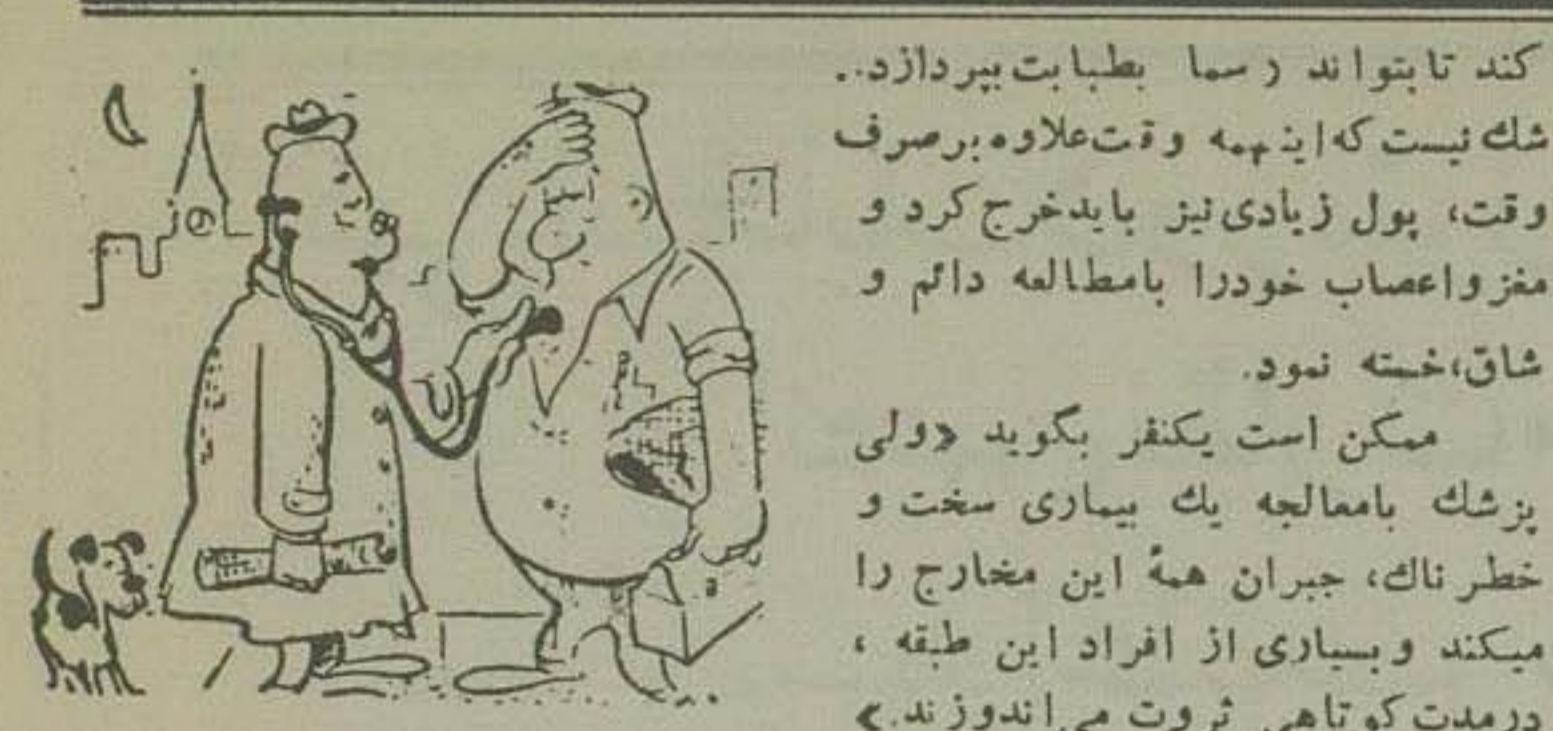
بسیاری از بیهوشان تشخیص بزرگان شک میرند

بزرگان که توانسته اند بیمار را به ادامه معالجه یا انتخاب دارو هدایت کنند، افزوده میشود