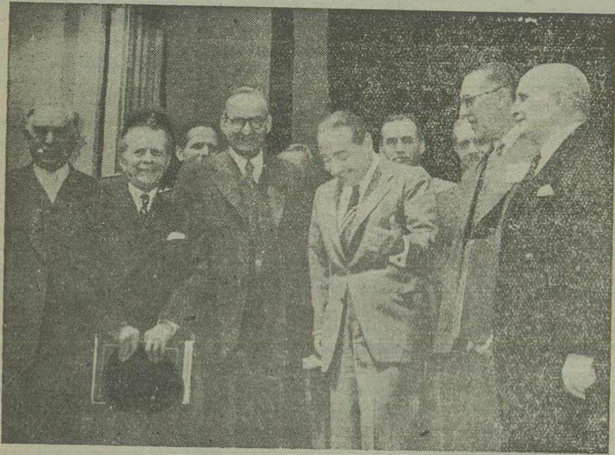
سران هیئت های نمایندگی کشورهای شرکت کننده در کنفرانس تهران هنگام خروج از آخرین جلسه کنفرانس

منظور پیمان بغداد کمک به تحقق یافتن هدف اولیه منشور ملل در حفظ صلح و امنیت بین المللی و پیشرفت رفاه بشر میباشد گرچه تغییری در تاکتیک های شوروی بعمل آمده ولی هدف های کمونیسم بین المللی بلا تغییر مانده است شورای وزیران پیمان بغداد ضرورت حل و تسویه تفریق اختلافات فلسطینی و کشمیری را تأیید نمود جلسه آینده شورای وزیران پیمان بغداد در ژانویه ۱۹۵۷ در گراچی منعقد میشود در ژانویه ۱۹۵۷ یک مرکز انرژي اتمی برای استفاده کشورهای عضو پیمان بغداد افتتاح میشود عدنان مندرس نخست وزیر ترکیه قبل از آنکه خاک ایران را ترک کند بحضور ملوکانه شرفیاب خواهد شد