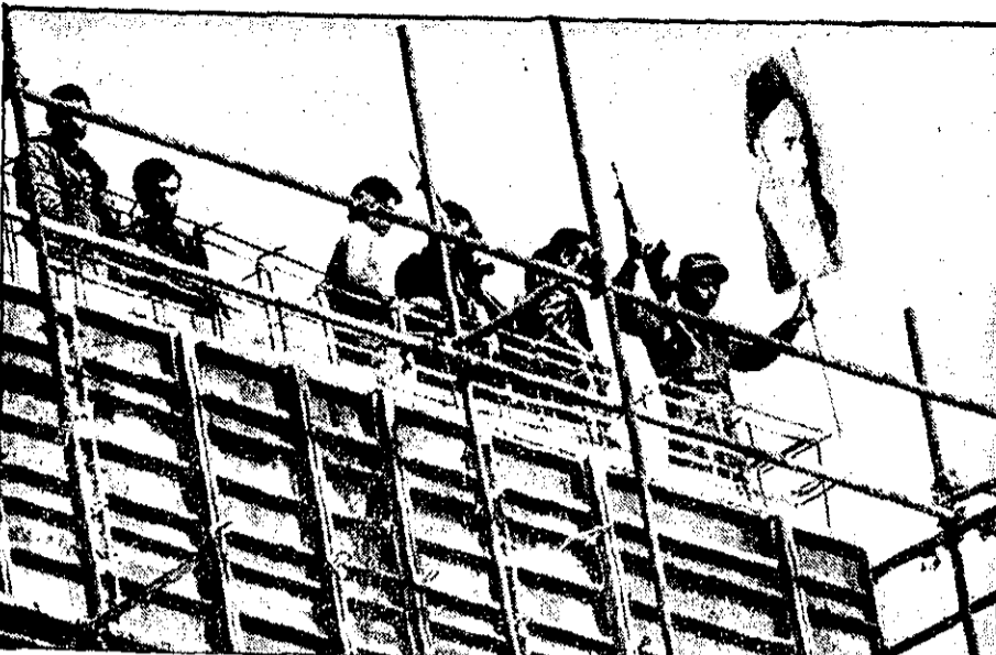
یک سرباز مسلسل خود را در یک دست و عکس امام خمینی را در دست دیگر تکان میدهد. مرد با لباس شخصی مسلسل خود را بالا گرفته است. عکس ساختمان را در کنار پادگان نیروی هوایی نشان میدهد