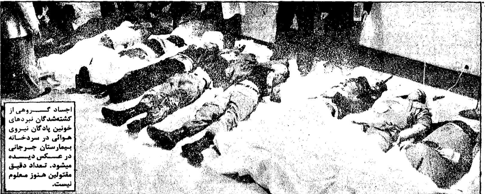
اجساد گسریه از کشته‌شدگان نبردهای خونین پادگان نیروی هوایی در سردخانه بیمارستان جرجانی در عکس دیده میشود. تعداد دقیق مقتولین هنوز معلوم نیست.

مردم مسلح به یاری افراد نیروی هوایی رفتند