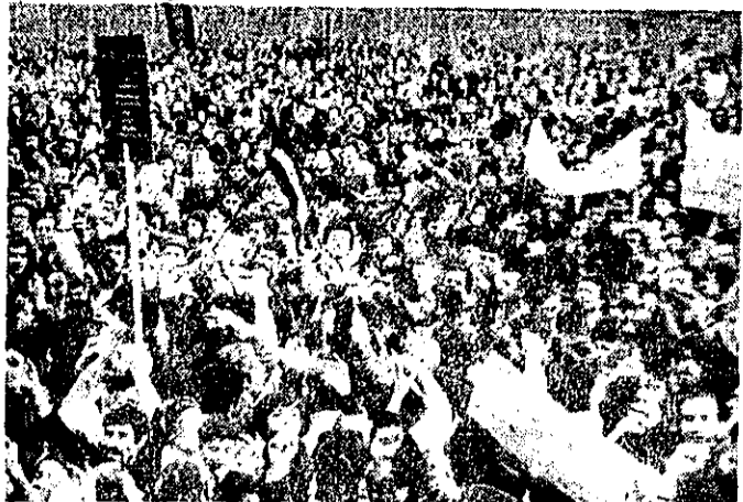
دیروز طرفداران قانون اساسی در اصفهان با در دست داشتن شعارهای حمایت از اختیار و آتش به تظاهرات پرداختند و فریاد می‌کردند که «حداکثر، امام ۱۲ آذر»

روز گذشته طرفداران قانون اساسی در اصفهان تظاهرات گسترده‌ای برگزار کردند. این تظاهرات در حمایت از قانون اساسی و در اعتراض به اقدامات غیرقانونی حکومت بود.