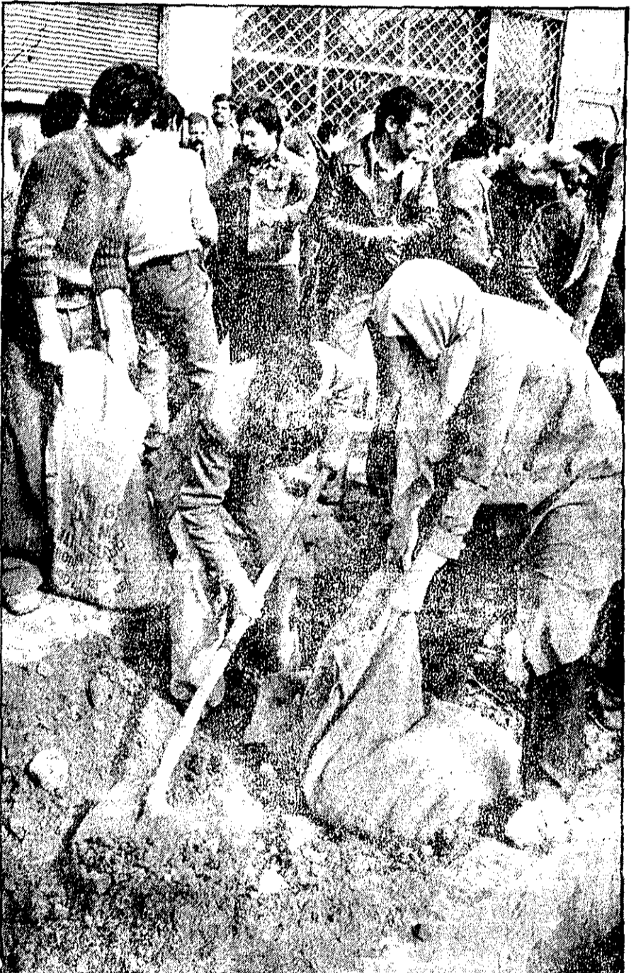
زنان و مردان کیسه‌ها را با خاک پر می‌کنند تا در خیابانها شش‌پندی کنند. شرق تهران امروز در دهها کوچه و خیابان نبرد احتمالی را تدارک می‌دید