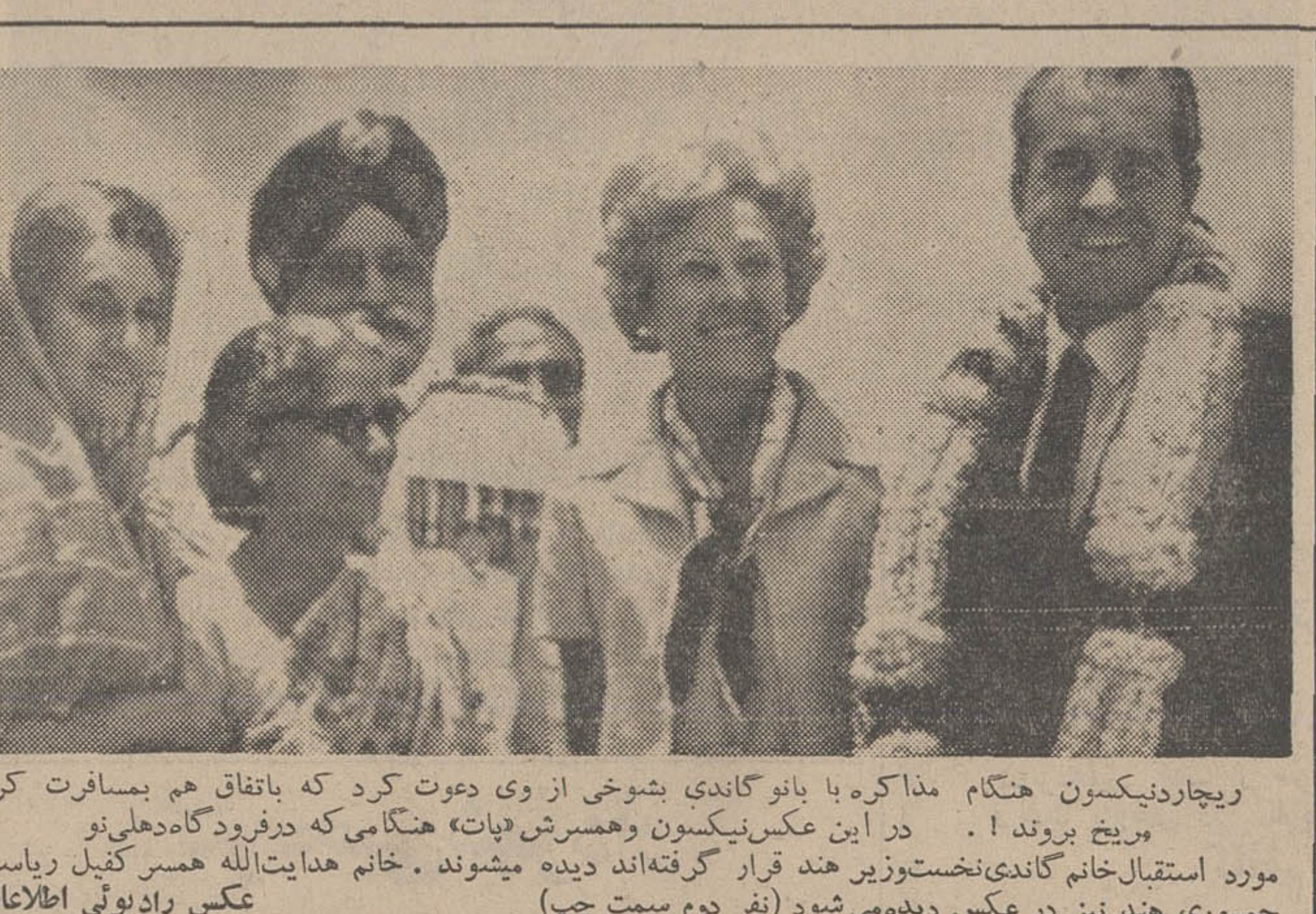
ویچاره‌نیکسون هنگام مذاکره با بانو گاندی بشوخی از وی دعوت کرد که با تفاق هم بمسافرت کره مریخ بروند. در این عکس نیکسون و همسرش «پات» هنگامی که در فرودگاه گاه‌گلی نو مورد استقبال خانم گاندی نخست‌وزیر هند قرار گرفته‌اند دیده میشوند. خانم هدایت‌الله همسر کنیل ریاست جمهوری هند نیز در عکس دیده‌می‌شود (نفر دوم سمت چپ) عکس رادیویی اطلاعات

مردم درباره تاکسی تلفنی اظهار نظر میکنند تاکسی تلفنی برای پولدارهاست ● یک نفر ساکن جنوب شهر: ما با اتوبوس سرو کار داریم تاکسی تلفنی نمی‌شناسیم! ● یک نفر ساکن شمیران: نرخ پیشنهادی با فلفلی که انچه داده خوبست ● یک نفر ساکن جنوب شهر: فکر مراجعه به آراء عمومی افتاده نکنند می‌خواهد گران شدن نرخ تاکسی را گردن مردم بیندازد