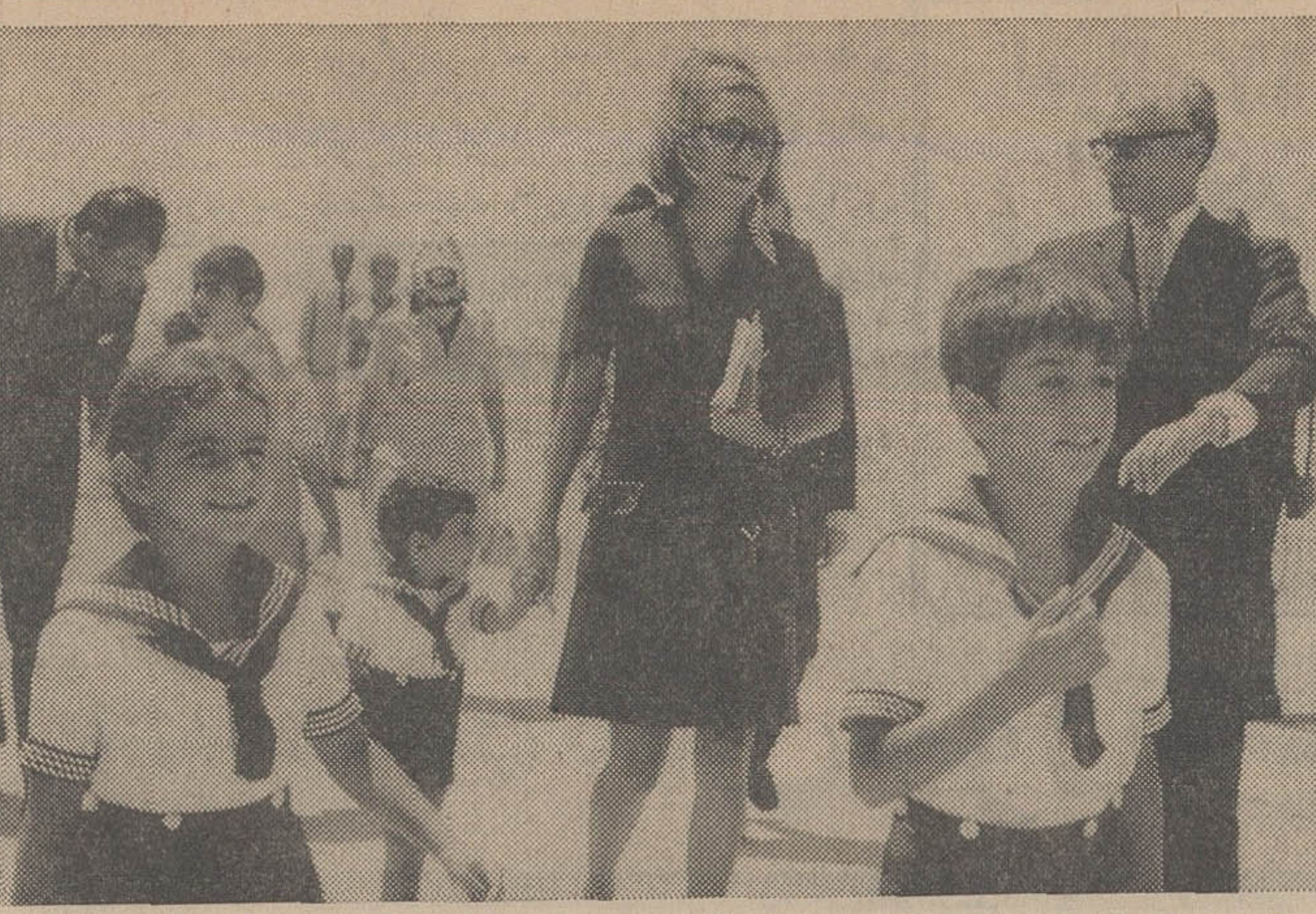
شاهنشاه آریامهر و علیحضرت شهبانو والاخرتین پیش از ظهر امروز از نوشهر تهران مراجعت فرمودند عکس اعلیحضرتین و والاخرتین را پس از ورود تهران در فرودگاه مهرآباد نشان میدهد. شرح در صفحه چهارم

امروز بر نامه کامل کنکور دانشگاه که از چهارشنبه شروع شده و تا شنبه ادامه خواهد داشت اعلام گردید صبح روز دوشنبه (پس‌فردا) توزیع اصفهان، تبریز، مشهد، پیلوی کارت ورود بجله کنکور سراسری شیراز، چندیشاپور اهواز و دانشکده دانشگاه ها و مدارس عالی دولتی کشاورزی رضایه حوزه‌های کنکور در حوزه های مختلف تهران و هستند و کارت ورود بجله‌ها امتحان شهرستان ها آغاز می گردد و تا توزیع می نمایند. بعد از ظهر روز سه‌شنبه ادامه خواهد داد و طلبان با در دست داشتن شناسنامه در تهران دانشگاه های تهران، عکس‌دار و برگ رسید مدارک که از صنعتی آریامهر و ملی ایران، آنان ارسال شده باید برای دریافت دانشسرای عالی، مدرسه عالی بازرگانی، کارت مراجعه نمایند. دانشکده صنعتی پلی‌تکنیک و دبیرستان های عاصمی، رضاشاه کبیر و رازی چهارشنبه آغاز میگردد و تا بعد از ظهر و در شهرستان ها دانشگاه های